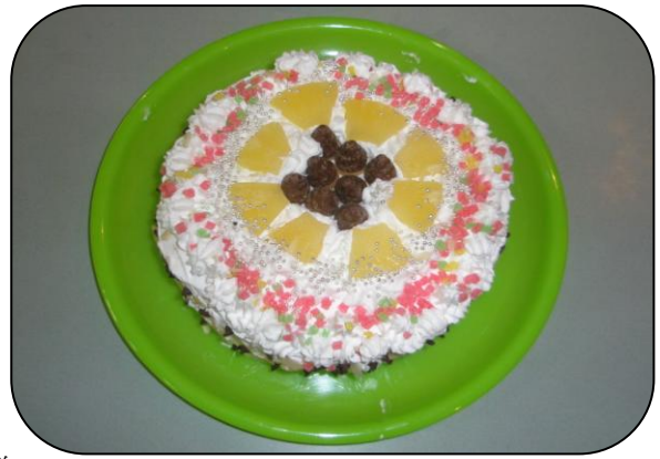
「森の姫」(コンテストで優勝したケーキ)

3月3日 デイケアセンターにてひな祭り会が行われました。午前中は各班にわかれてケーキ作りです。ケーキ各班に2種類のフルーツと3種類のトッピングが配られ、さあ開始です。ケーキコンテストが行われることもあり、グループの中ではノート図案を描いている班もありました。生クリームは機械があり交代で泡立てしてトッピング。できあがったケーキの投票は自分たちの班には入れられないというルールで、 メンバー全員と病院関係者 に投票してもらいました。午後はビンゴゲームです。縦、横、斜め5マスあいたらビンゴです。景品は15位までありました。ビンゴゲームはいつやっても盛り上がります。ケーキコンテストの優勝は8班の「 森の姫 」でとてもかわいいトッピングでした。3位までは景品がありました。特別賞として名誉院長賞がありました。1票も入らないのではと心配する班もありましたが、かろうじて何票が入っていました。コンテストが終わったあとみんなで食べました。後かたづけは面倒でしたが、みんなおいしく頂けて幸せな時間でした。