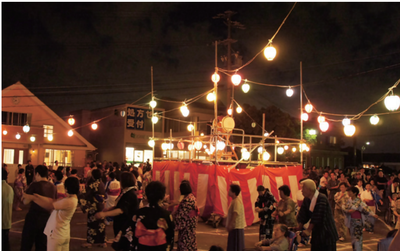
7/31今年も盛大に盆踊り大会を開催しました。