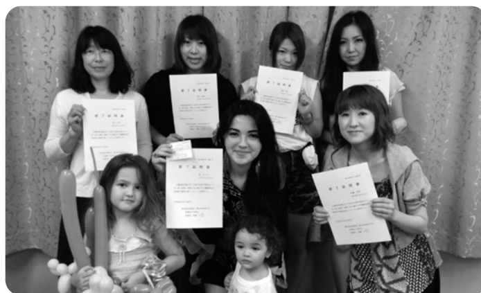
受講生のみなさん、「合格おめでとうございます!!」