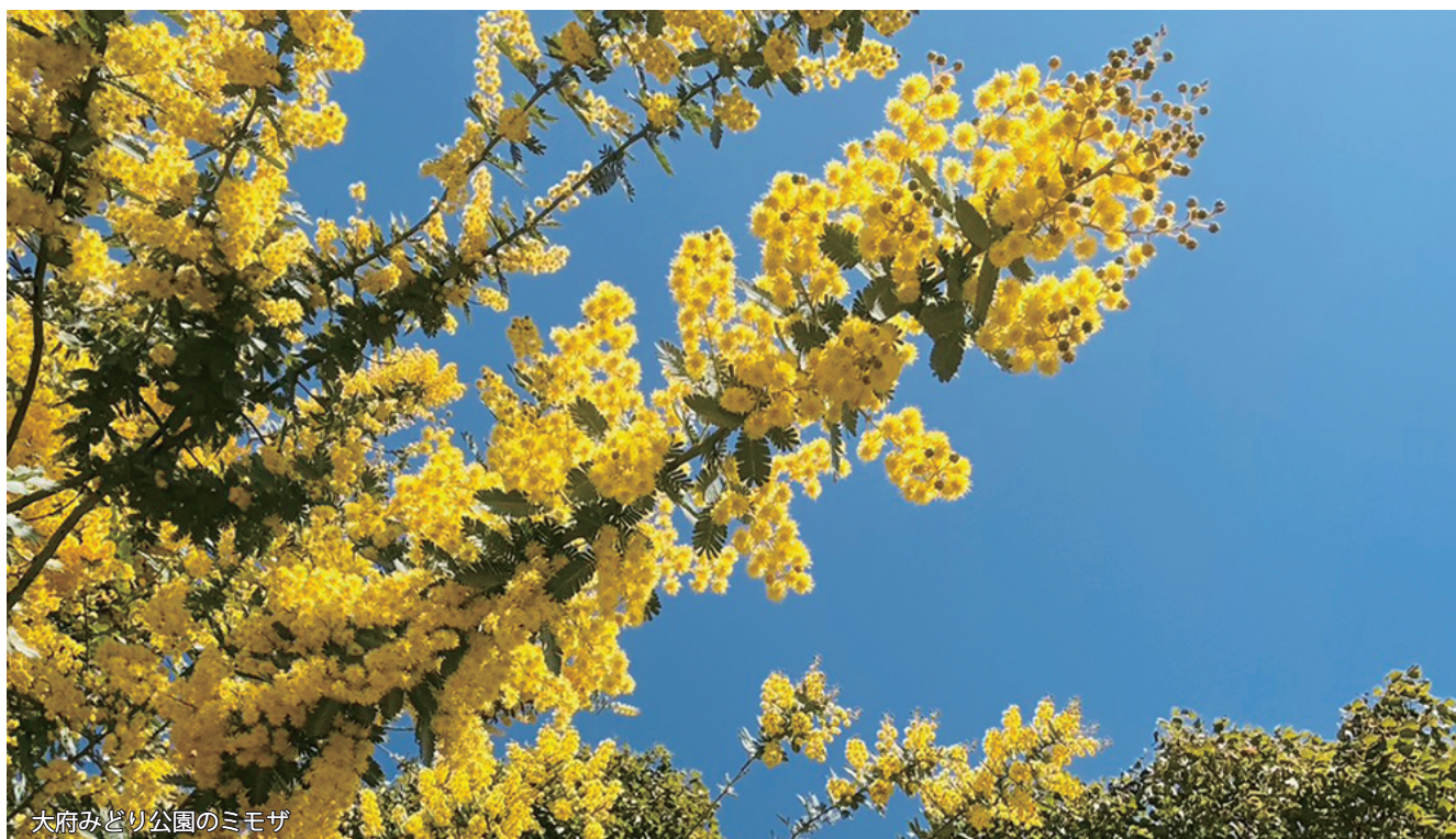
大府みどり公園のミモザ