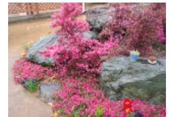
芝桜とマンサクのピンクがとてもきれいです。

今年、10 月で開所 5 年目を迎えるあしびもいよいよ障がい者社会復帰施設から新法の障がい福祉サービス事業所への移行準備を始めます。まだまだ先が読めない状況の中にいますが、目標は来年の 4 月です。関係機関と連携を取りしっかりと準備に入りたいと思います。